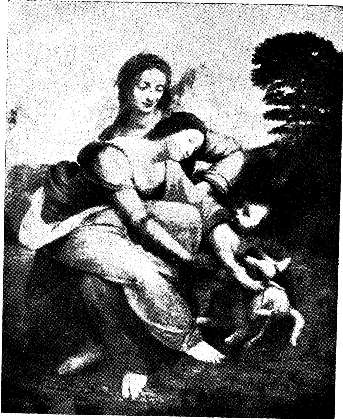
‘कुमारी माता, बालक व सेंट अँन’ (मेरी, बाळखिस्त व सेंट अँन)